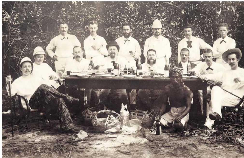
Zu Füssen der Herren: «Schweizer-Ausflug nach der Insel Edam» – nördlich des heutigen Jakarta.

Schlicht «Museum» steht in Goldbuchstaben über dem Hauseingang mitten im Appenzeller Dorf Heiden. Das kleine Museum, das in den oberen Stockwerken des Hauses eingerichtet ist, wurde 1859 gegründet und beherbergt eine vielgestaltige Exponatensammlung. Nebst ausgestopften einheimischen Tieren und historischen Einrichtungs- und Haushaltgegenständen aus der Gegend zeigt das Museum diverse Artefakte aus dem heutigen Indonesien: Waffen, Hüte, Stoffe, eine ausgestopfte Python, die gemäss Infotafel 1896 lebendig in Heiden ankam, ihren ersten Winter dort aber nicht überlebte. Appenzeller Handelsreisende, die in Südostasien auf den Spuren niederländischer Kolonialherren Geschäfte machten, hatten die Objekte in die Heimat zurückgebracht.